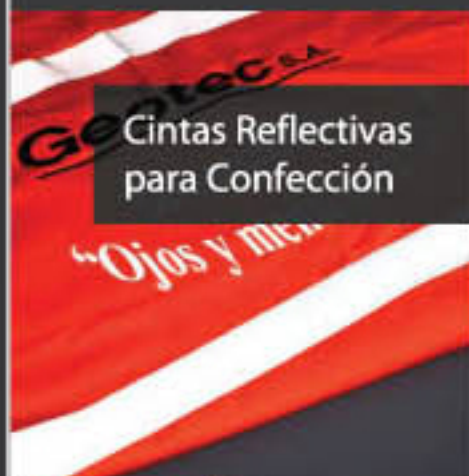
Cintas Reflectivas para Confección

Buscamos ofrecerte la mejor calidad, al mejor precio